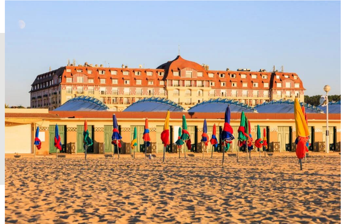
Plage de Deauville